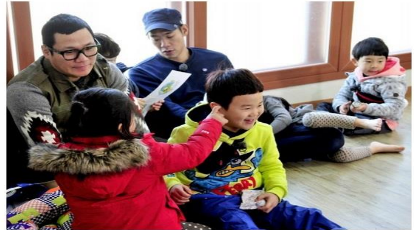
‘아빠어디가?’ 속 아빠들과 아이들

아버지는 쇠락하고, 아빠가 부상한다. 권위의 상징이었던 아버지는 이제 대중매체를 통해 시대의 퇴물처럼 묘사되는 반면, 다정하고 따뜻한 아빠는 이상향처럼 그려진다. 대표적인 프로그램이 MBC ‘일밤’의 ‘아빠!어디가?’다. 이 프로그램이 흥하면서, KBS2 ‘해피선데이’의 ‘슈퍼맨이 돌아왔다’ 등 육아 예능프로그램이 유행처럼 번졌는데, 이 프로그램들에 출연하는 아빠들은 모두가 아이들에게 친구와 같은 존재다. 친구같은 아빠를 뜻하는 용어도 생겼다. 친구를 뜻하는 프렌드(Friend)와 아빠 대디(Daddy)를 합친, 프렌디(Friendly)가 그것이다.